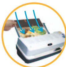
Insertion des documents par l'arrière

Cette plastifieuse capable de traiter rapidement des documents de grand format (jusqu'à A3) a de quoi séduire les plus exigeants : un temps de chauffe rapide, une vitesse de plastification élevée et un mode « veille » qui lui permet de se mettre en route encore plus rapidement. Bref, voilà une machine de qualité aux performances élevées capable de s'acquitter de travaux lourds sans difficulté .