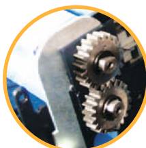
Mécanisme performant permettant une vitesse élevée de plastification (environ 800 mm/min)