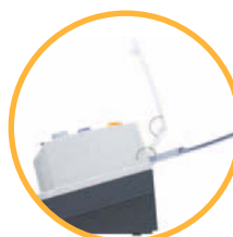
Support de document pliable pour un gain de place