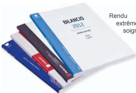
Rendu extrêmement soigné.

Cette petite machine aide à mettre en place les reliures en papier autocollantes de type «Papercomb/Imagecomb» sur votre document à relier pour un rendu impeccable et très professionnel.