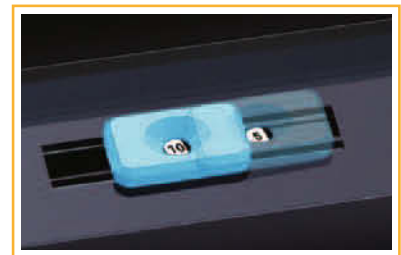
Sélecteur de diamètre de reliure pour un ajustement précis de la fermeture.