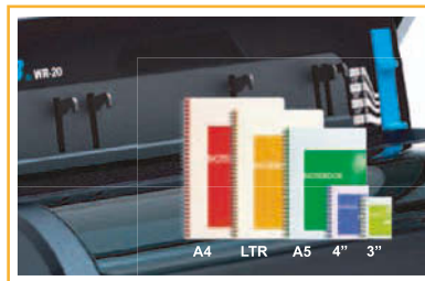
5 poinçons débrayables (n° 9, 12, 25, 33, 34) pour répondre à tous les besoins.